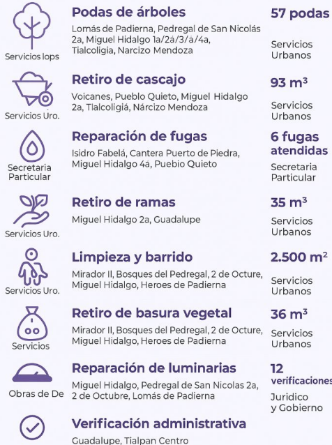
Tabla de Gestiones