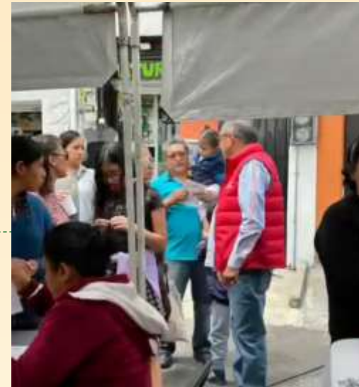
Acudimos como invitados a una jornada de Salud en la colonia Miguel Hidalgo 1a. Sección.