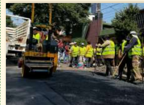
Acompañamiento al arranque del programa "Bachetón: camino libre de baches" en la Col. Isidro Fabela.