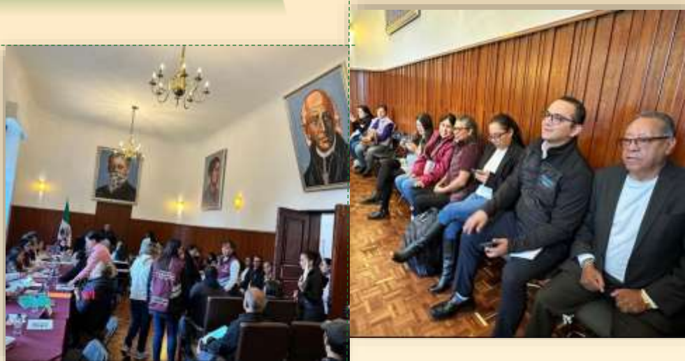
1a. Audiencia Pública en Salón Cabildos.