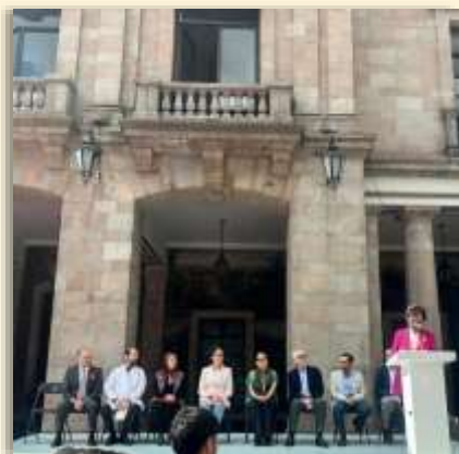
Acompañamiento a la Alcaldesa y a las y los Directores de Salud de los diferentes hospitales de especialidades para conmemorar el "DÍA MUNDIAL DEL CANCER DE MAMA".