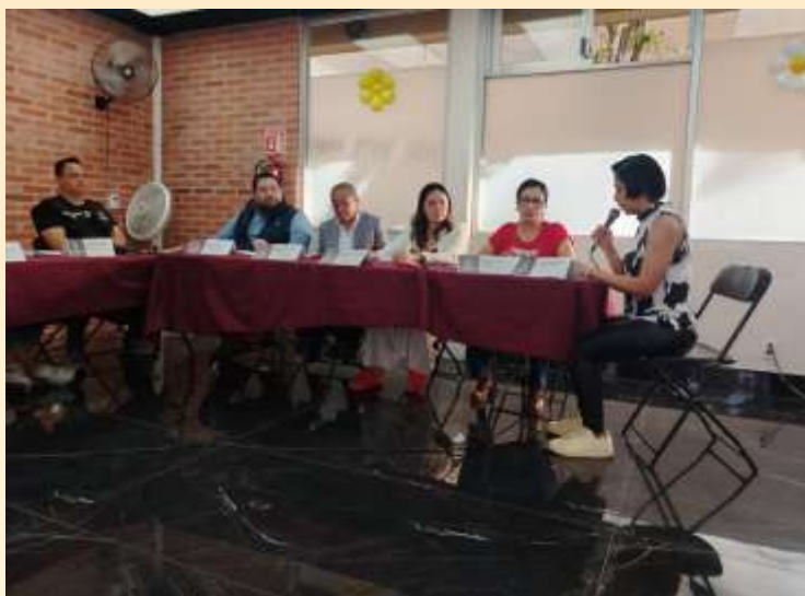
Se llevó a cabo la 4a. Sesión de la Comisión de Jurídico. Y Gobierno

— ALCALDÍA — TLALPAN NUESTRA CASA SE TRANSFORMA 2021 - 2027