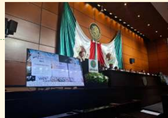
"FORO ALTERNATIVA SUSTENTABLES PARA LA CDMX".